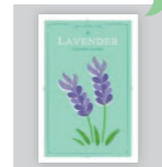
ペーパーキリング ラベンダーのカード