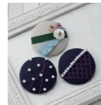
刺し子とリボンのブローチ