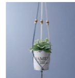
マクラメグリーンハンギング

同じ材料でも、みんな違う表情にしあがるかわいいうさぎは大人気。「一つはお孫さんに顔を仕上げてもらうの」と共同作業にした例も。