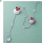
つまみ細工でつくる うさぎとふくろうの つるし飾り