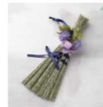
ブーケ付き 紙たたみほうき