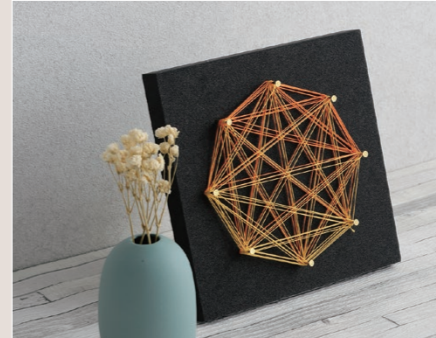
※画像は完成イメージです。

最新のテココロキットはオンラインショップをご覧ください カタログ掲載時より仕様変更、価格変更の可能性があります。詳細はオンラインショップをご確認ください。