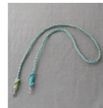
マクラメ ネックホルダー